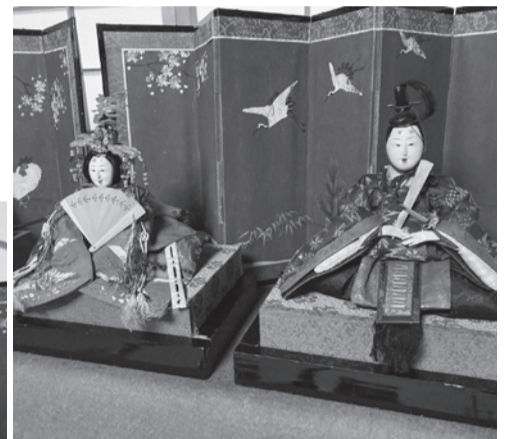
内裏雛 (佐竹資料館蔵) 江戸時代から続く老舗人形店・吉徳大光