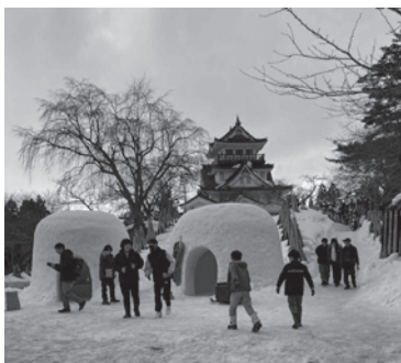
横手城でのかまくら