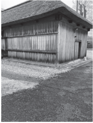
秋田藩主佐竹氏別邸