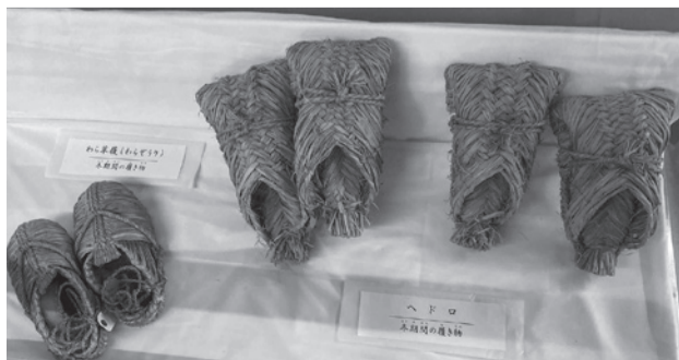
昔のスケート (わらざうり)