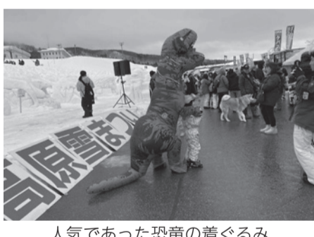
人気であった恐竜の着ぐるみ