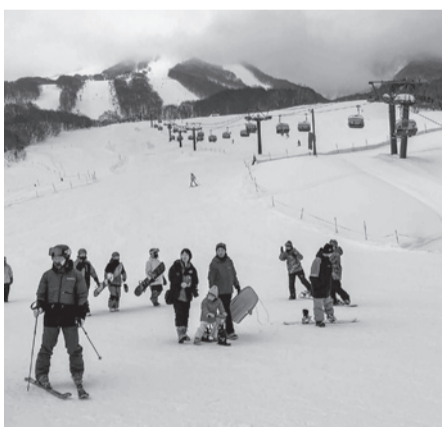
雪まつり会場からすぐスキー場