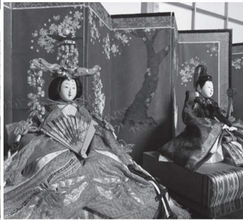
内裏雛 (桃柳軒玉山 作) 佐竹資料館蔵